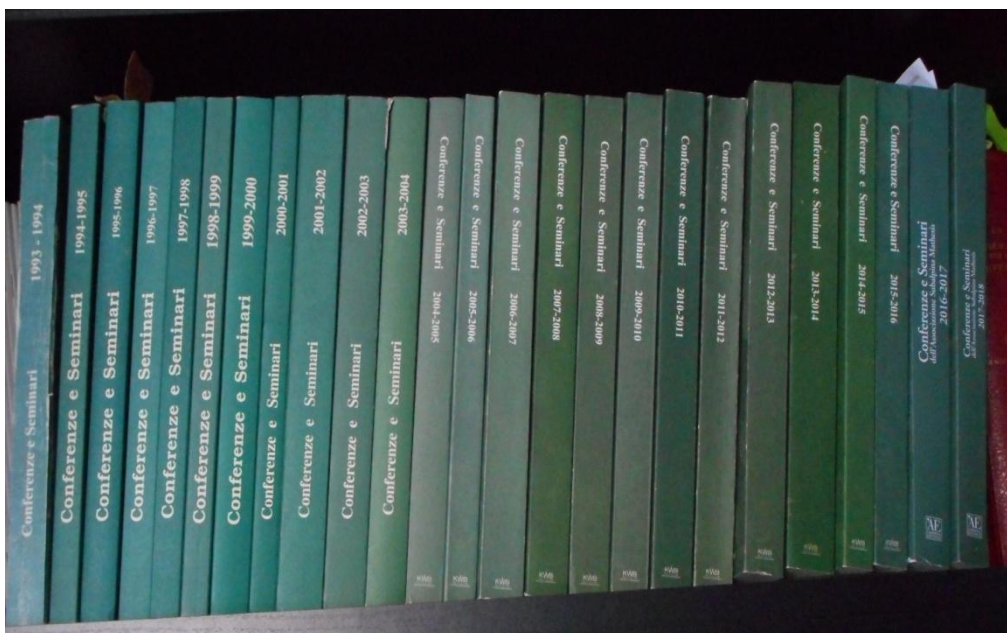
Biblioteca Salmeri – Tutti i 25 volumi